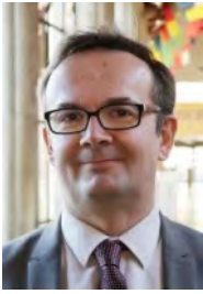
M. Samuel LAINÉ

Magistrat issu de la promotion 1995, il a été nommé en 1997 substitut à Lille, juge d'instruction à Douai en 2000 puis substitut à Pointe à Pitre en 2002. Il sera ensuite nommé à l'administration centrale du ministère de la justice en 2004. De retour en juridiction, il fut successivement premier vice-président à Quimper en 2010, vice-président chargé du tribunal d'instance de Bordeaux en 2015 puis mis à disposition auprès de l'administration centrale du ministère de la justice Cabinet du Garde des Sceaux (Conseiller services judiciaires et réformes statutaires) en 2016. Il fut ensuite nommé premier vice-président adjoint à Bordeaux en 2017 avant d'être détaché auprès de l'École nationale de la magistrature, le 1 er décembre 2020, dans les fonctions de directeur adjoint chargé des recrutements, de la formation initiale et de la recherche.